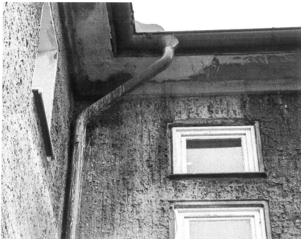
Fot.7. Narożnik w zbliżeniu; gołębie gniazdują w obrębie dachu.