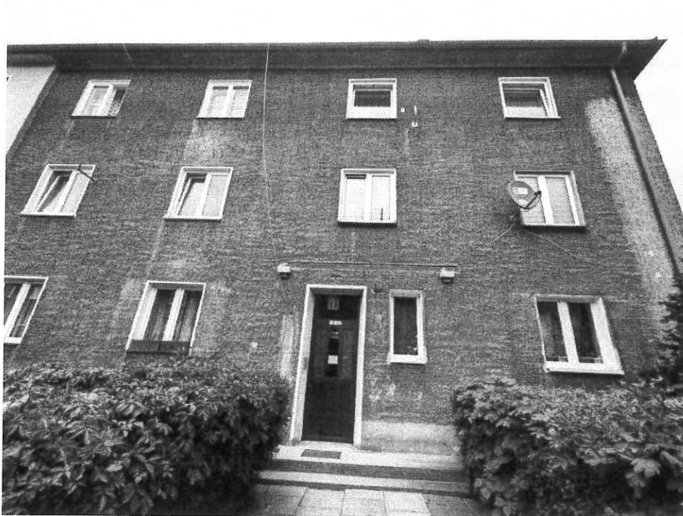
Fot.1. Widok od południa.