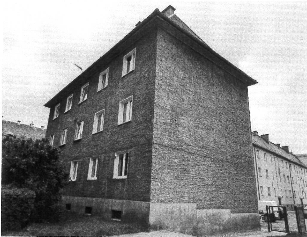
Fot.5. Widok od pn-wsch.