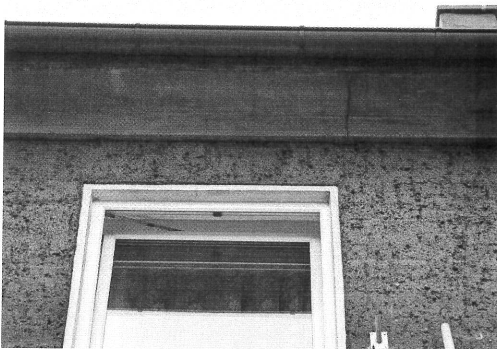
Fot.2. Część stropowa od południa.