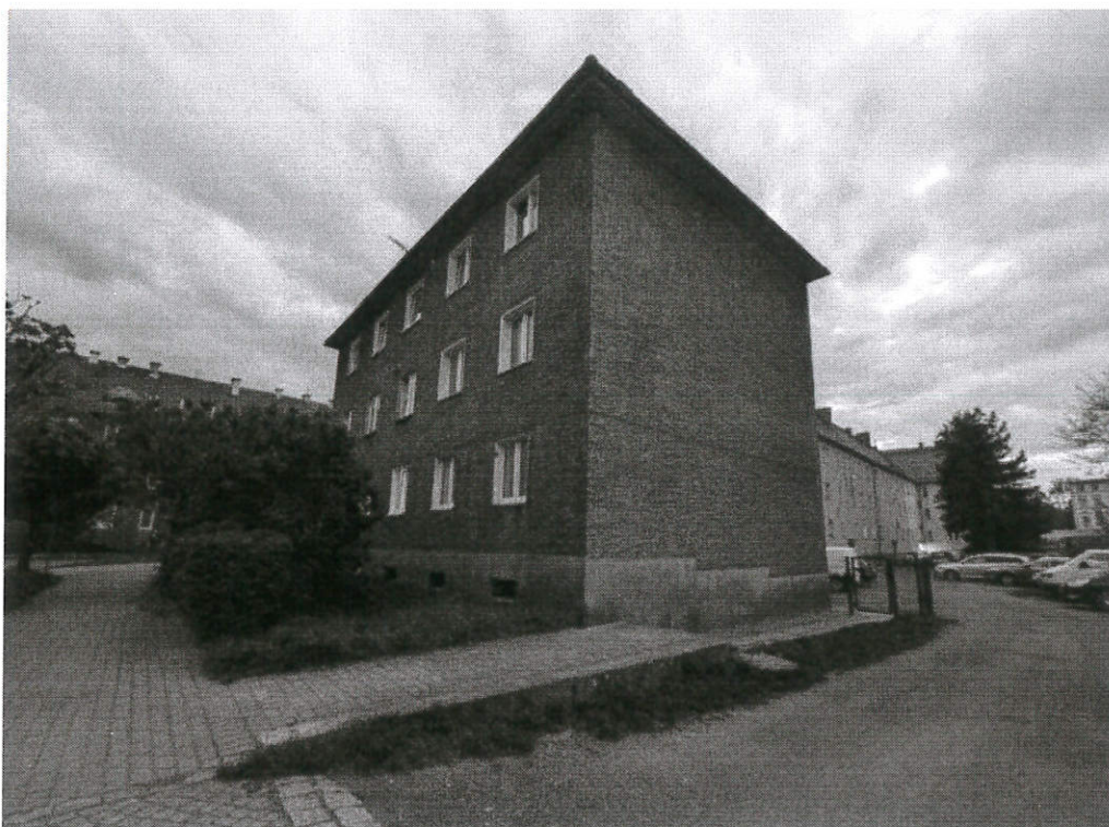
Fot.9. Widok od pn-wsch podczas kontroli wieczornej (aut. Szymon Wójcik).