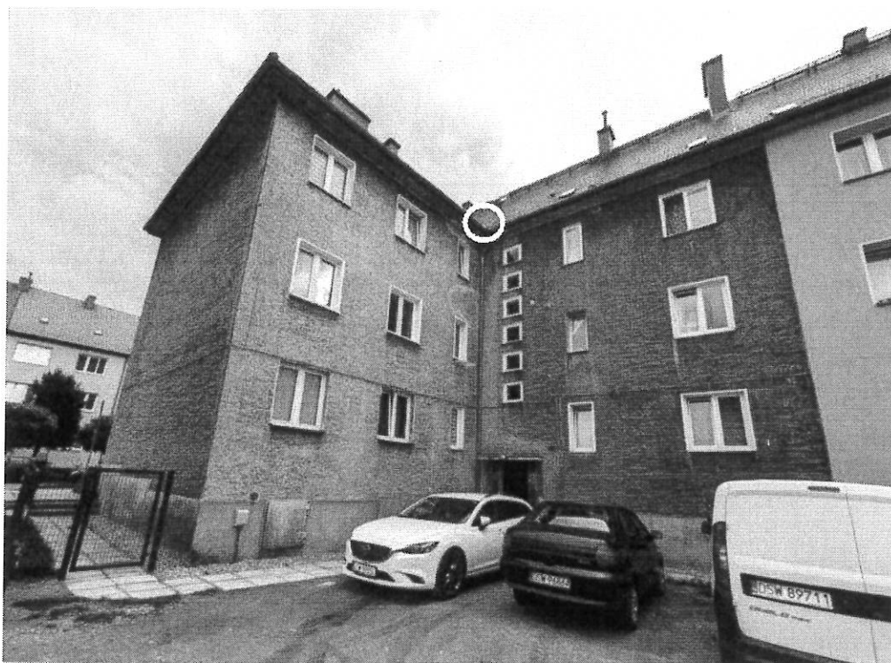
Fot.6. Widok od pn-zach; oznaczono miejsce gniazdowania gołębia miejskiego na granicy rynny i dachu.