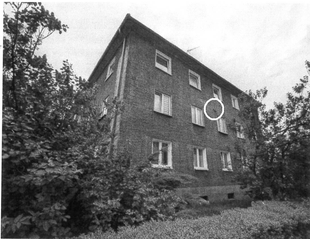
Fot.3. Ściana wschodnia; oznaczono potencjalne siedlisko wróbla (aut. Szymon Wójcik).