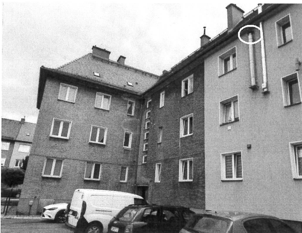
Fot.8. Oznaczono gniazdo gołębia na sąsiednim segmencie.