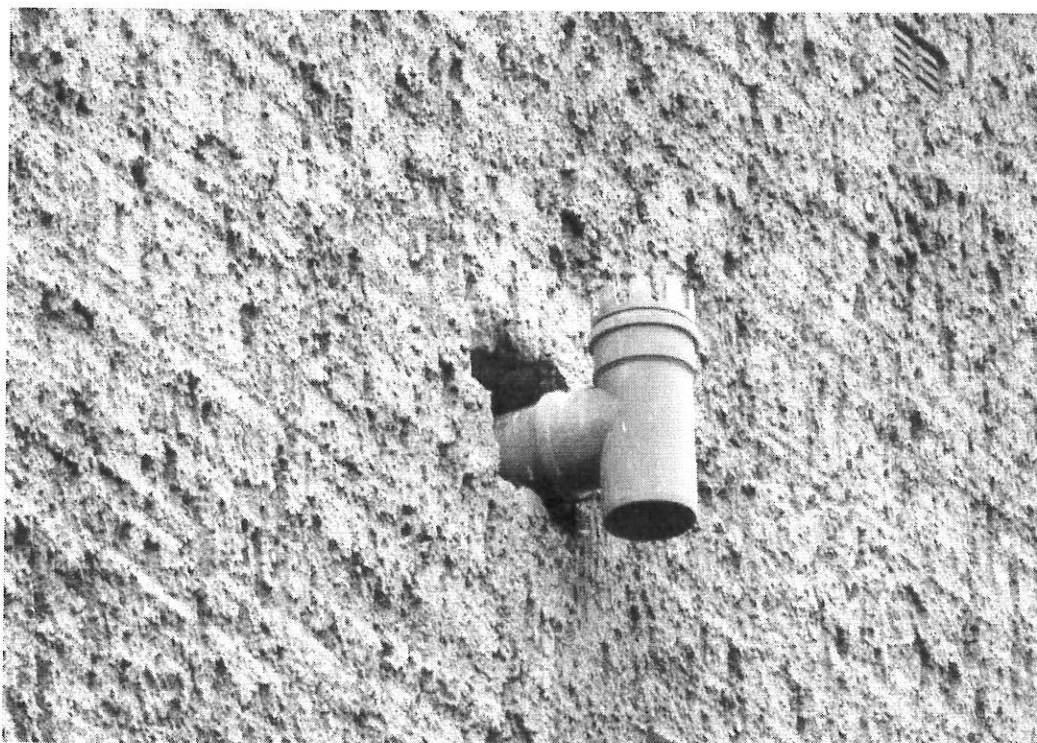
Fot.4. Potencjalne siedlisko wróbla w zbliżeniu.